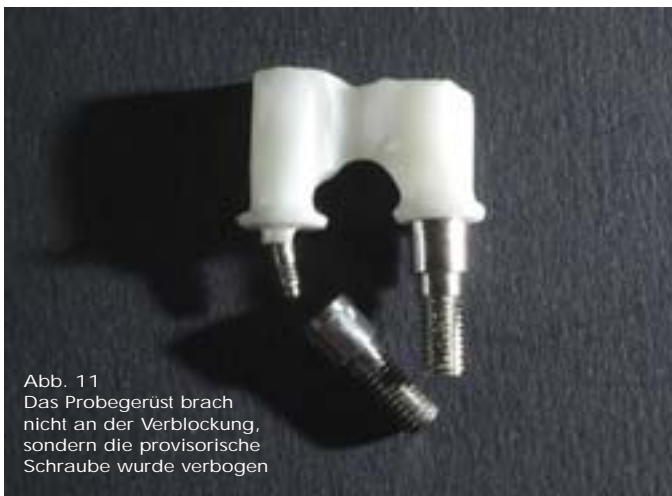
Abb. 11 Das Probegerüst brach nicht an der Verblockung, sondern die provisorische Schraube wurde verbogen