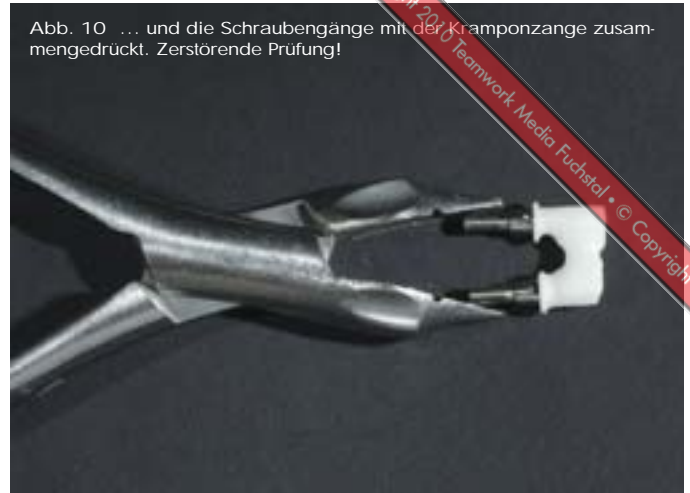
Abb. 10 ... und die Schraubengänge mit der Kramponzange zusammengedrückt. Zerstörende Prüfung!