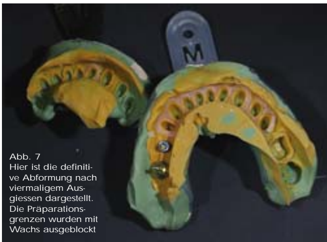
Abb. 7 Hier ist die definitive Abformung nach viermaligem Ausgießen dargestellt. Die Präparationsgrenzen wurden mit Wachs ausgeblockt