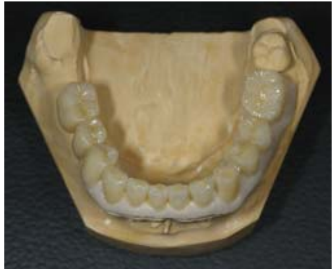
Abb. 4 Ein Provisorium aus zahnfarbenem Autopolymerisat wurde angefertigt. Im Vestibulum wurde zusätzlich Autopolymerisat aufgebracht. Dieses Zahnfleischschild dient der sicheren Positionierung des Provisoriums im Patientenmund

empfunden wird. Denn nur wenn der Patient die Schiene konsequent trägt, kann er sich langsam an seine neue Bisshöhe gewöhnen. Erst wenn der Patient die neue Situation als angenehm und normal empfindet und sein Einverständnis gibt, kann die Versorgung fortgesetzt werden.