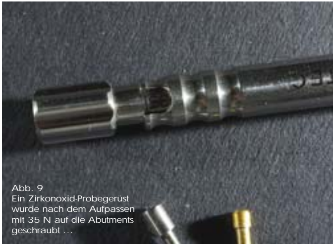
Abb. 9 Ein Zirkonoxid-Probegerüst wurde nach dem Aufpassen mit 35 N auf die Abutments geschraubt ...