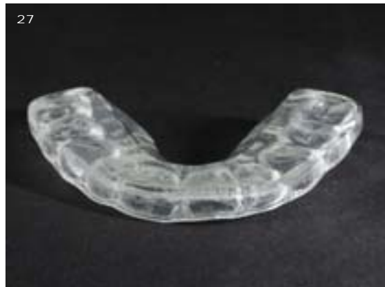
Abb. 26 und 27 Zum Abschluss wurde zum Schutz des Kiefergelenks und der Restaurationen eine Michiganschiene angefertigt

Die fertige Restauration präsentiert sich in der Abbildung 24 im Artikulator. Nun kann die Restauration in die Praxis gebracht und eingesetzt werden (Abb. 25).