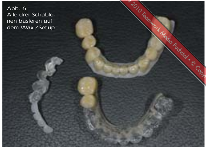
Abb. 6 Alle drei Schablonen basieren auf dem Wax-/Set-up