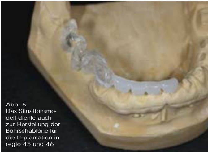
Abb. 5 Das Situationsmodell diente auch zur Herstellung der Bohrschablone für die Implantation in regio 45 und 46