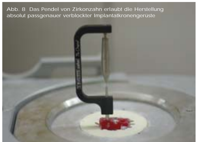
Abb. 8 Das Pendel von Zirkozahn erlaubt die Herstellung absolut passgenauer verblockter Implantatkronengerüste