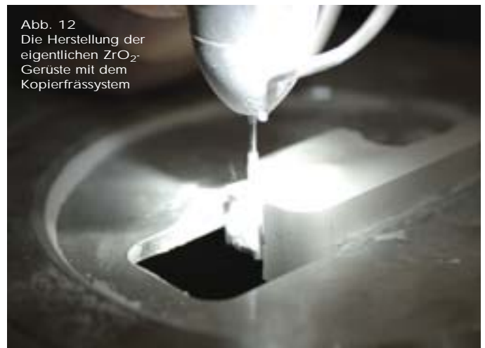
Abb. 12 Die Herstellung der eigentlichen ZrO_2 -Gerüste mit dem Kopierfrässystem

sem Fall haben wir uns bewusst für Zirkonoxid entschieden, da dieses Material gerade bei der Bisshebung eines Bruxers einige Vorteile aufweist.