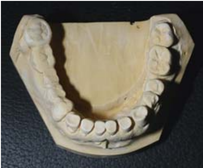
Abb. 1 Der Patient wies ein stark abradiertes Gebiss auf. Anhand der Abformung der Ausgangssituation wurde im Labor ein Modell erstellt