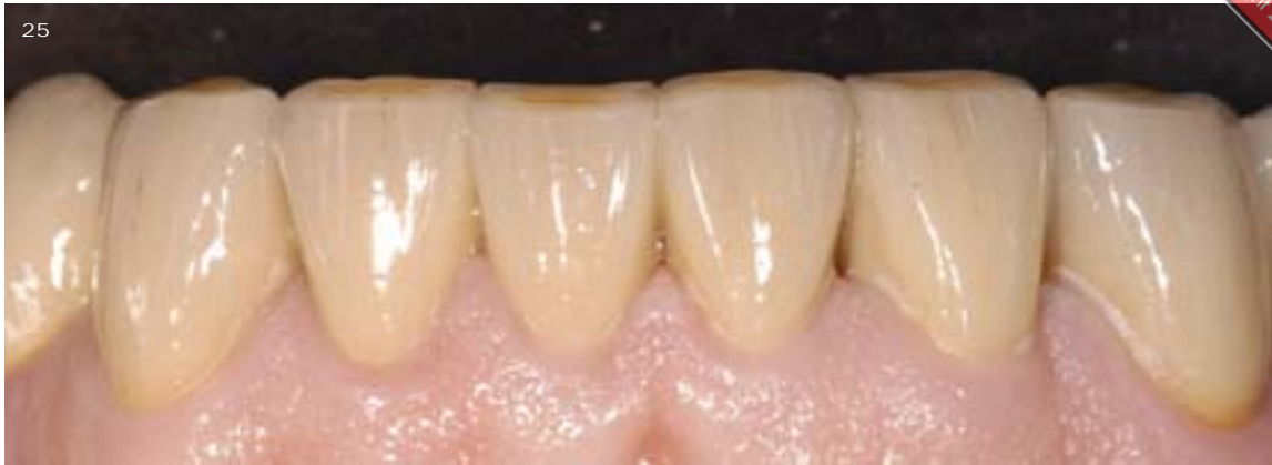
Abb. 25 Die fertigen Unterkieferkronen nach einem Monat Tragezeit. Die Mundhygiene weist leider Mängel auf