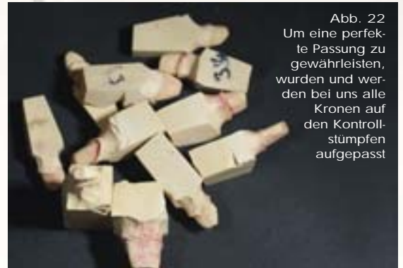
Abb. 22 Um eine perfekte Passung zu gewährleisten, wurden und werden bei uns alle Kronen auf den Kontrollstümpfen aufgepasst