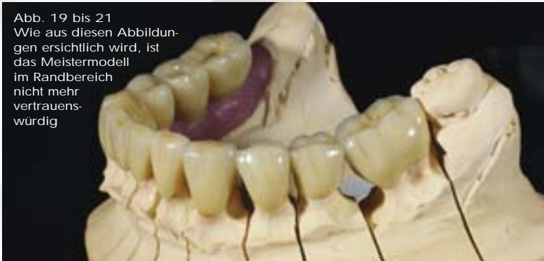
Abb. 19 bis 21 Wie aus diesen Abbildungen ersichtlich wird, ist das Meistermodell im Randbereich nicht mehr vertrauenswürdig