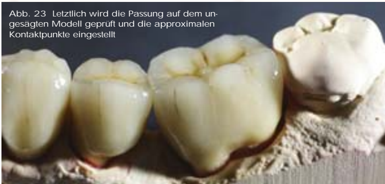
Abb. 23 Letztlich wird die Passung auf dem ungesägten Modell geprüft und die approximalen Kontaktpunkte eingestellt