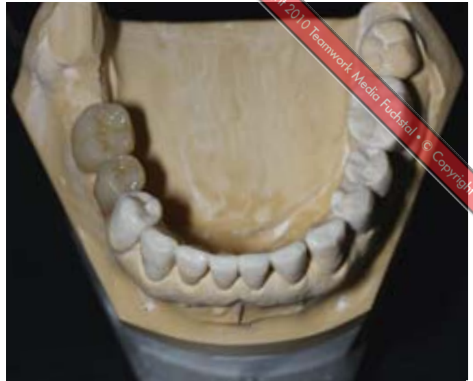
Abb. 2 Um die geplante Okklusion und die gewünschte Bisshebung erreichen zu können, wurde jeder Zahn einzeln gnathologisch aufgewacht. Die geplanten verblockten Kronen regio 45 und 46 wurden als Set-up aufgestellt