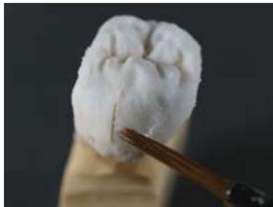
Abb. 17 und 18 Hier ist die Imitation eines vertikalen Schmelzrisses dargestellt

sorgung auf eine fehlende Langzeitabkühlung zurückzuführen sind. Eine Neuherstellung war jedoch in keinem der Fälle notwendig. Aus diesem Grund sind wir mit dieser Technologie sehr zufrieden. Kontrollstümpfe sind bei Zirkonoxid-basierten Restaurationen noch wichtiger als bei VMK-Restaurationen. Wie man in den Abbildungen 19 bis 21 sehr gut erkennen kann, ist der Randbereich des Meistermodells nicht mehr sehr vertrauenswürdig. Aus diesem Grund wurde und wird jede Krone auf dem Kontrollstumpf aufgesägt (Abb. 22). Da-