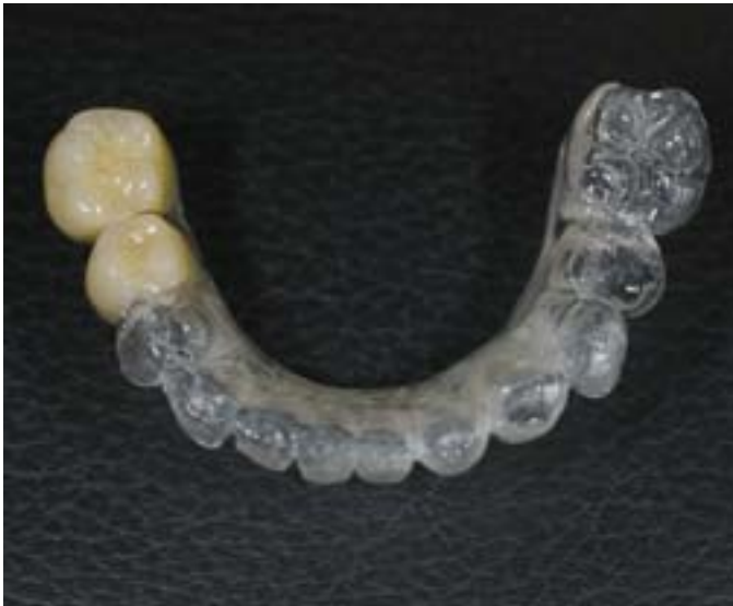
Abb. 3 Das modifizierte Modell wurde dupliert und auf dessen Basis das Wax-up mit einem transparenten Autopolymerisat in Kunststoff umgesetzt